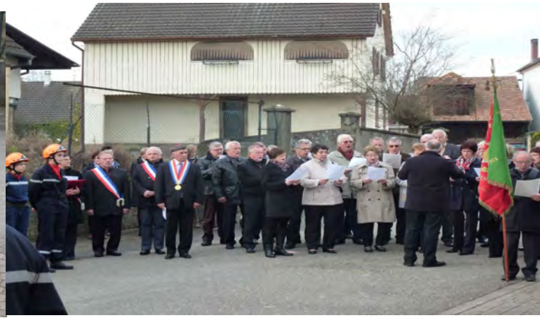
Les chorales et la musique ont animé la cérémonie