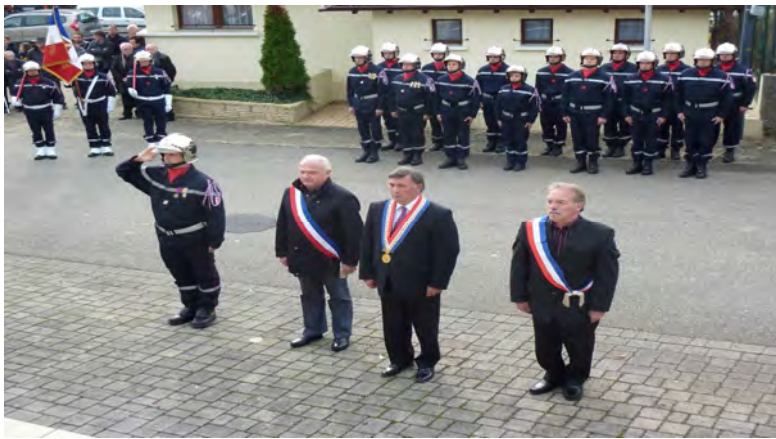
Médailles et distinctions pour les Pompiers

Chez nous aussi l'hommage pour ce centième anniversaire a eu un écho particulier, nombre de citoyens de notre village ont perdu la vie dans ce qui a été le sommet de l'horreur durant quatre années. Tous ces noms gravés sur le monument ne doivent pas tomber dans l'oubli, 12 jeunes hommes, sacrifiés sur l'autel de la barbarie humaine.