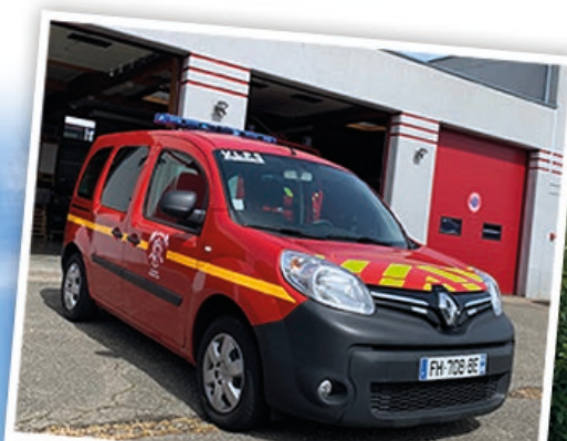
la mise en service de notre véhicule prompt-secours en début 2022