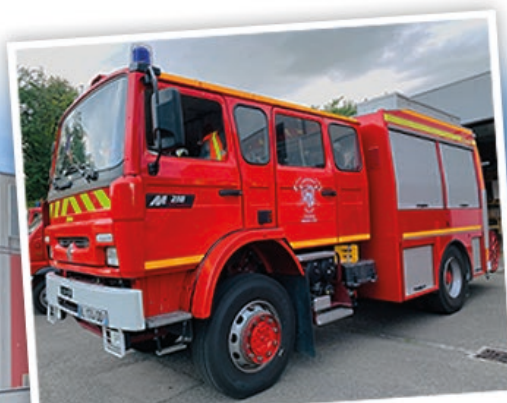
la mise en service de notre fourgon incendie en début 2020

Cette journée a été l'occasion l'occasion de vous faire découvrir les nouveautés principales du corps: