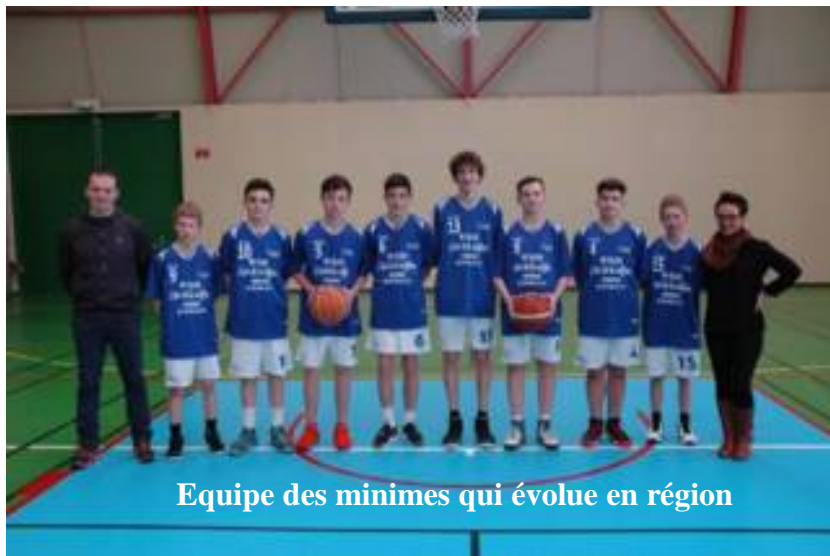
Equipe des minimes qui évolue en région