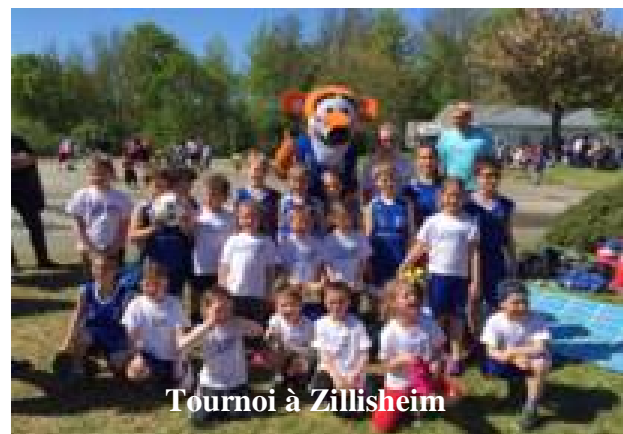
Tournoi à Zillisheim