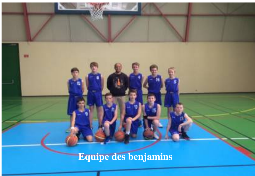
Equipe des benjamins