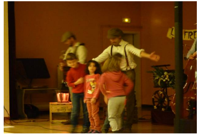
C'est sans peur que l'on participe sur scène