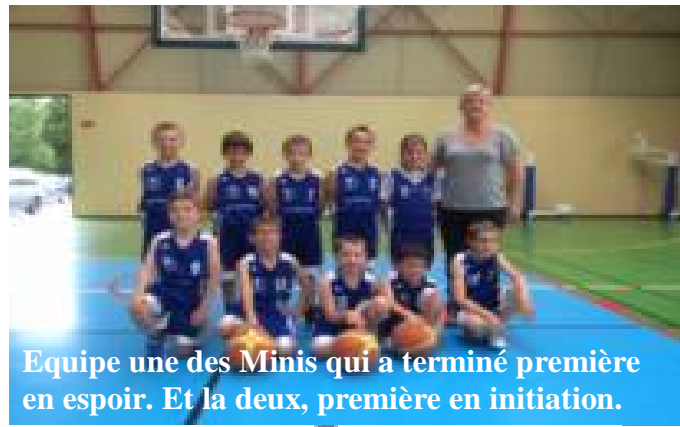
Equipe une des Minis qui a terminé première en espoir. Et la deux, première en initiation.