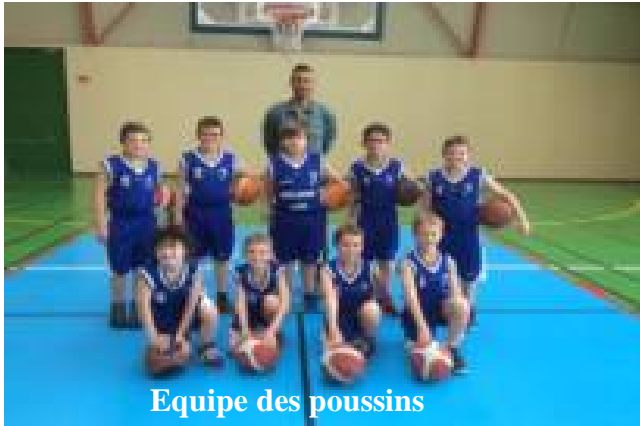
Equipe des poussins