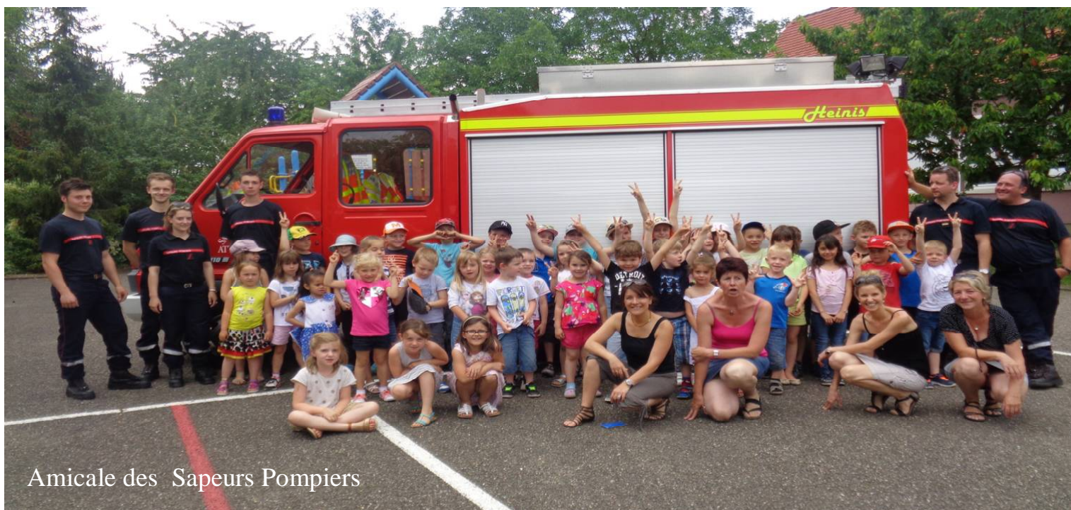
Amicale des Sapeurs Pompiers