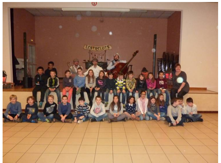
La photo souvenir indispensable pour une telle matinée