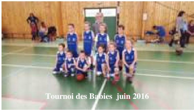
Tournoi des Babies juin 2016